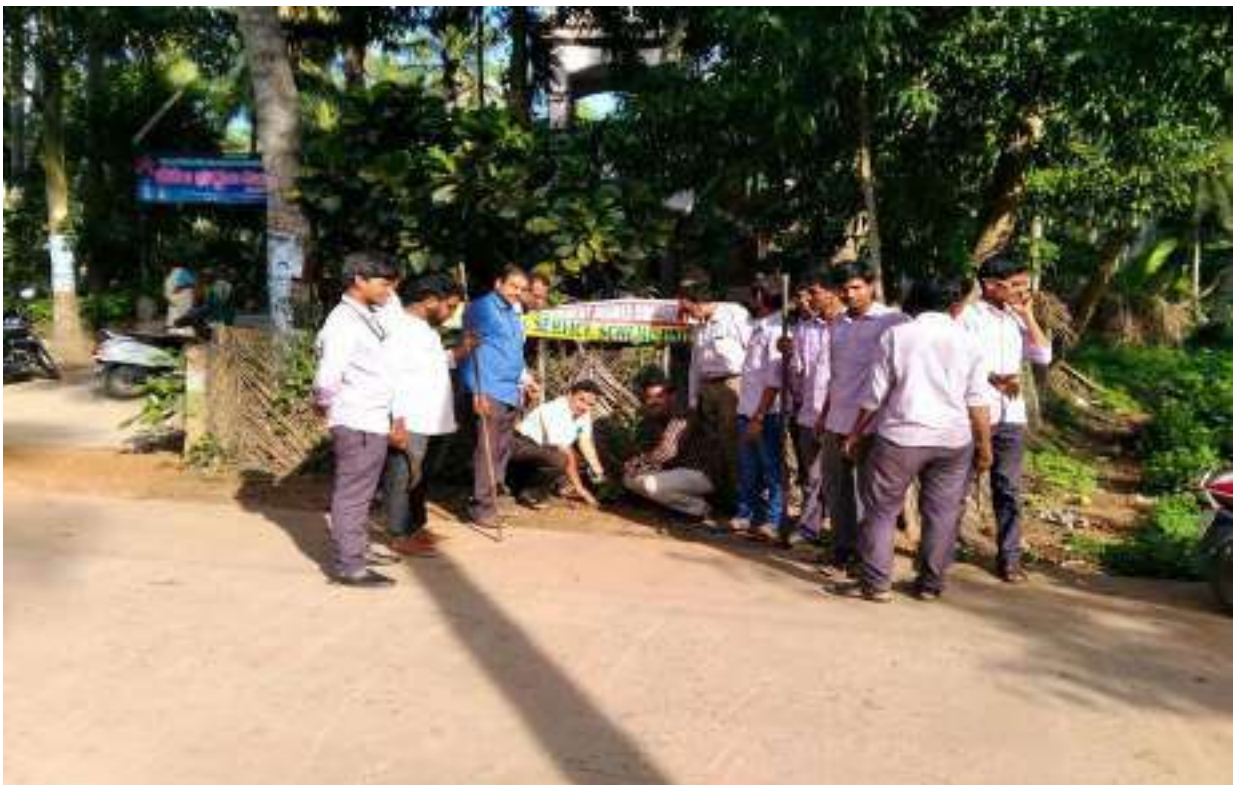
Plantation on trees at KONTERU Adopted Village BY NSS Volunteers