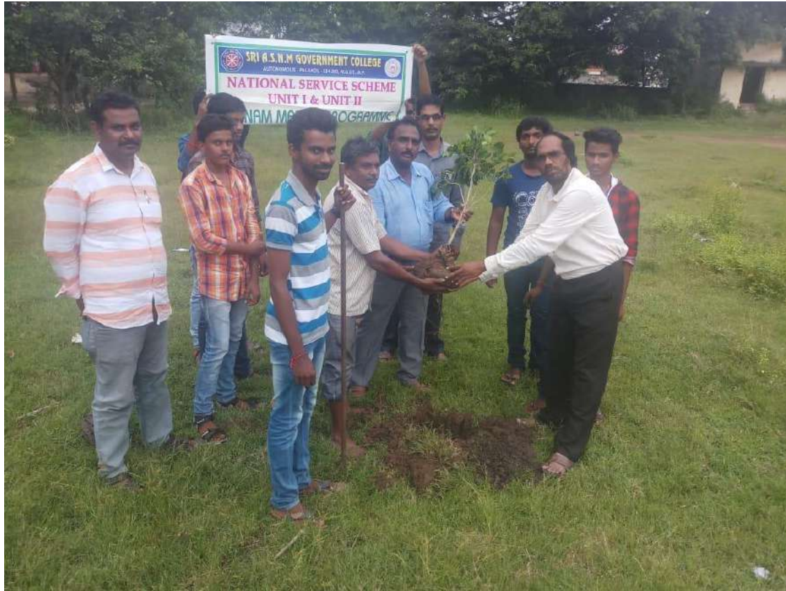
Plantation in the College Campus by NSS PO'Sand Volunteers