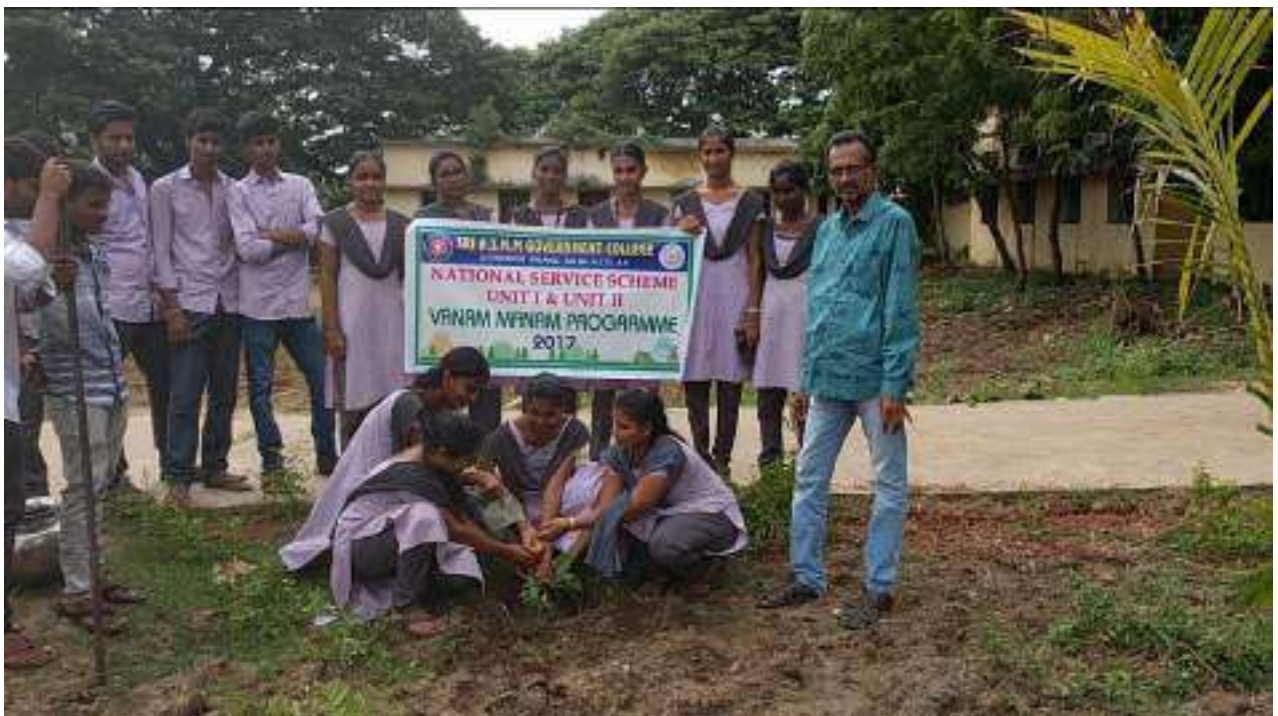
Plantation in the College Campus by Pricipal & NSS Volunteers