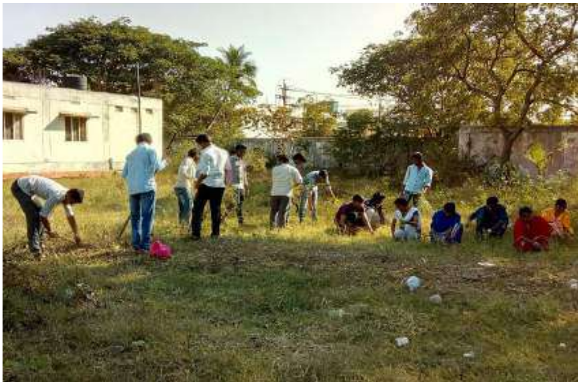
Cleaning of Hostel Premises by NSS Volunteers