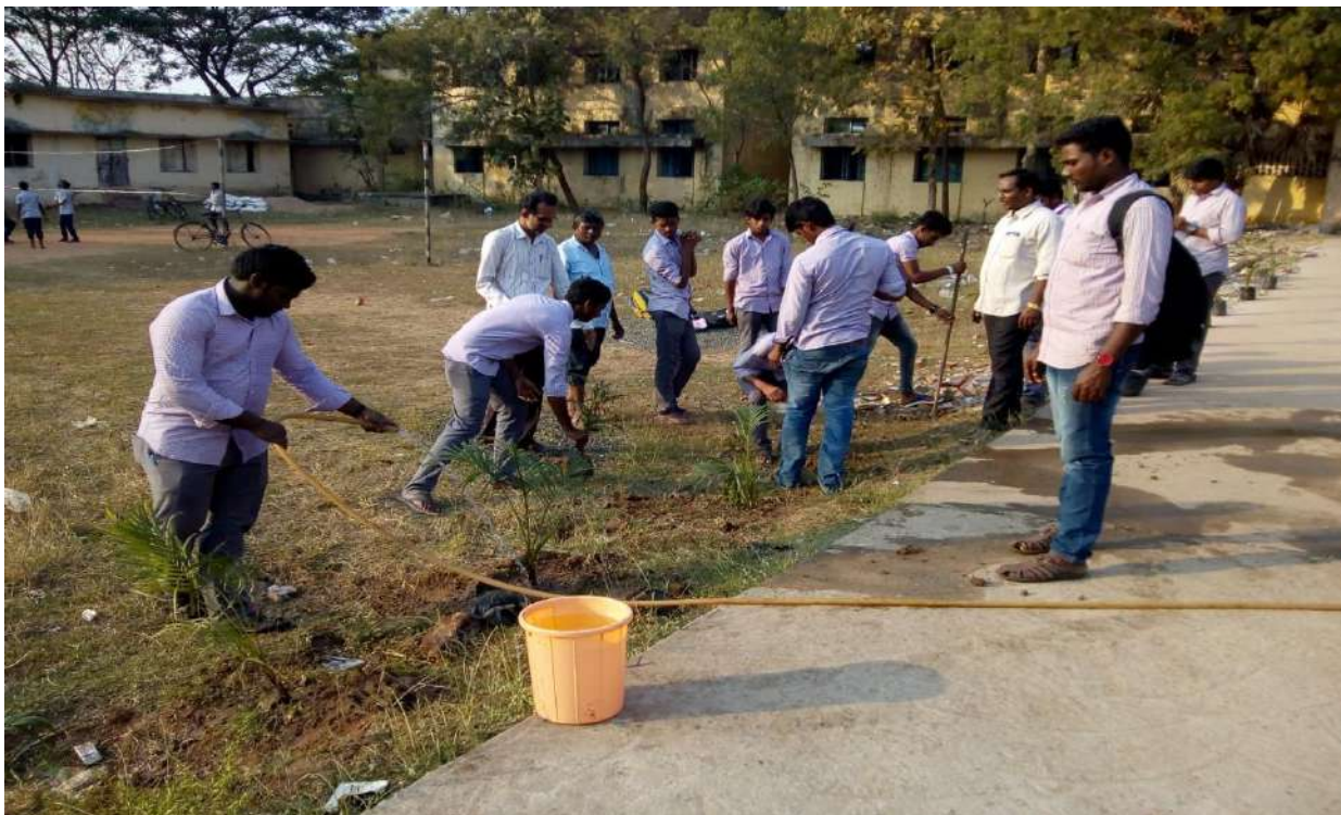
Plantation in the College Campus by NSS Volunteers