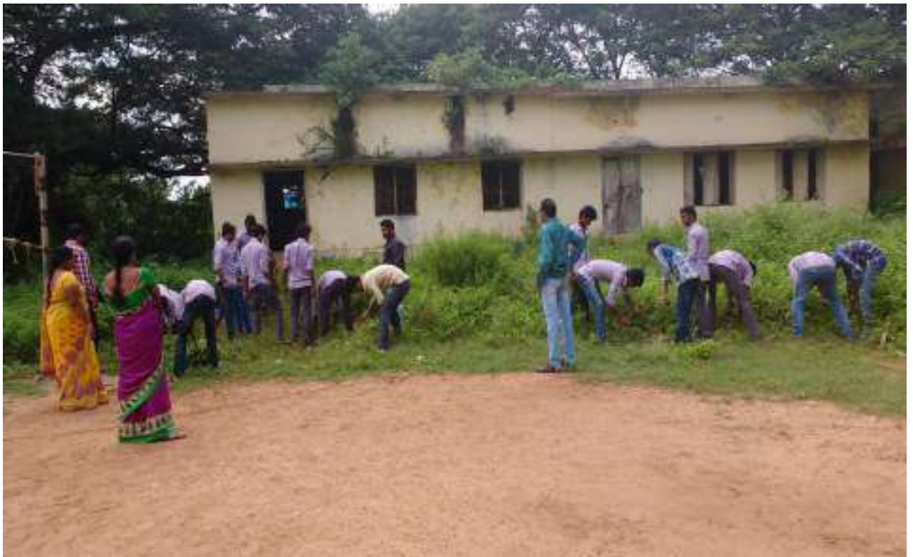
Cleaning of College Premises by NSS Volunteers