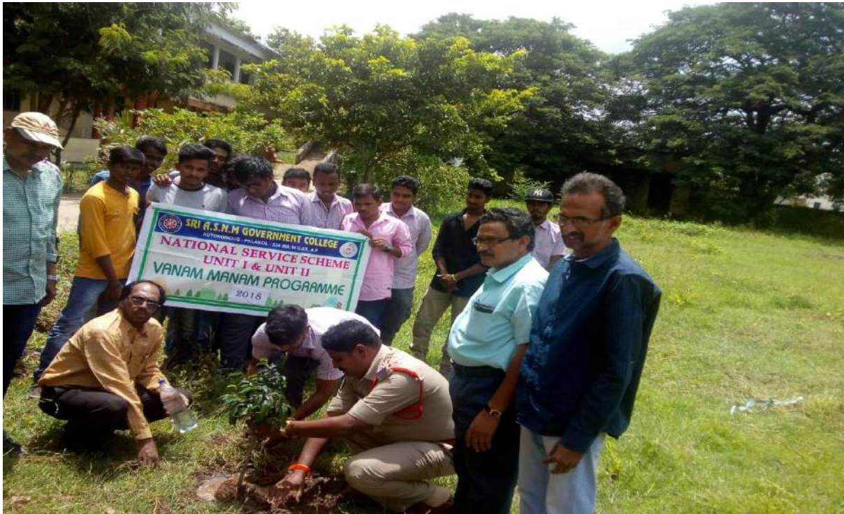
Plantation in the College Campus by CI of Police & NSS Volunteers