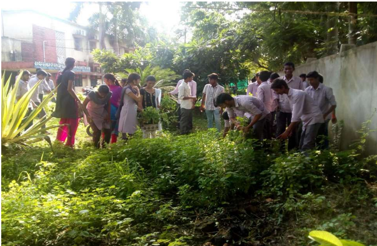
Cleaning of College Premises by NSS Volunteers