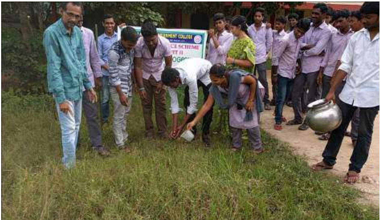
Plantation in the College Campus by NSS Volunteers