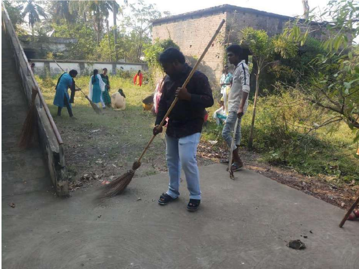
Swachbharath programme in college campus clean&green